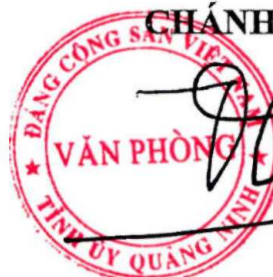
Dương Mạnh Cường